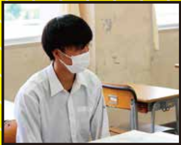
監督/脚本/石倉 正 撮影/藤井 建太 助監督/岡田 充哲 録音/平田 碧

畑の作物を食い荒らす獣、年寄りをだます悪い奴、上京して連絡のとれない息子など、じいちゃん・ばあちゃんは、ひどい目に遭うばかり。だが、たまにはひっくり返るようなことが起こるかも。