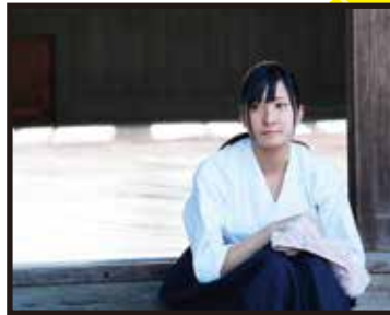
監督/脚本/山口 智宏 撮影/川本 竜平 助監督/田辺 清哉 録音/松本 明弘

都会の会社で、それなりのポジションで、周りのこともそっちのけで働いてきた楓。ある日、突然下された出向命令で鳥根県の邑南町へ行くことに。今まで何も受け入れようとしなかった楓だったが――。