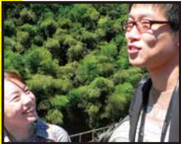
監督/脚本/新田 健 撮影/中村 晃司 助監督/五島 誠大 録音/能美 恭志

恵まれていない環境で自信を失いかけている生徒、教師、保護者。それぞれが互いに関わり合って、一歩ずつ前に進み出すお話です。学校がこういう場であつたら良いねという希望も込めて。