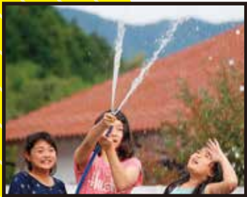
監督/脚本/岡 哲朗 撮影/桑原 弥 助監督/笹田 千尋 録音/中野 佑亮

田舎暮らしを決めた読書会メンバーの一人が、謎かけのように言い残した“実在の桃源郷”。メンバーたちは数年後にその地で読書会を行うことを決めた。やがて、当日。待ち合わせ場所でのメンバーを待つのは二人だけ。二人のそれぞれのバッグには作者の異なる『山椒魚』という小説が――。