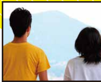
監督/脚本/坂根 陽介 撮影/三宅 悠生 助監督/矢島 亜紀 録音/錦織 大護

日照り続きの邑南町に突如現れた巨大なハンザケ(山椒魚)。水を求めてさまようハンザケと町を救うために立ち上がったのは、3人の小学生だった。町の人々を巻き込んだ騒動が今始まる。