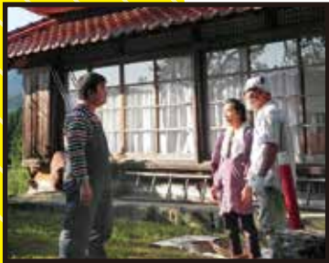
監督/脚本/村上 実明 撮影/林隆 和也 録音/森本 樹子

9作品すべてのチームを1日間にわたり追いかけて、熱気あふれる撮影現場の一瞬一瞬をとらえたスチール写真を会場にて一挙展示。また撮影の舞台裏を追いかけて、その空気感が伝わるメイキング映像も上映します。