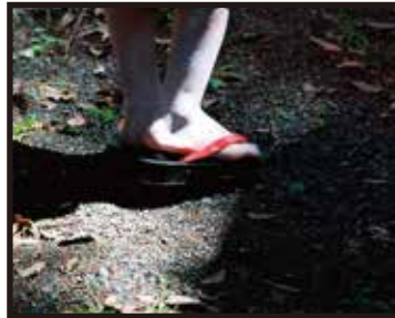
監督/脚本/金築 秀幸 撮影/大谷 辰夫 助監督/駒井 敏宏 録音/小松 佳穂

東京での生活に疲れ、自分の居場所を見失った綾香は姉・幸恵が暮らす邑南町に帰省してきた。久しぶりの再会もつかの間、ある日2人はふとしたことで衝突をしてしまう。お互いの感情がすれ違う中、やがて綾香は姉の本当の想いを知ることになる――。