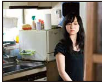
監督/脚本/大武 英樹 撮影/吉木 仁理 助監督/宮本 沙美 録音/恩田 修二

恋人だった翼を事故で亡くした亮。だけど翼は成仏していなかった!? 憑かされてけど、とっても幸せな二人に、修行僧の法月の怪しい影が忍び寄る。翼のわがままと亮の想いが錯綜するゴーストラブコメディ。