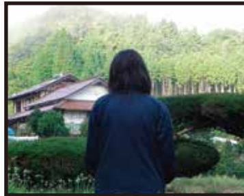
監督/川島 幸子 脚本/坂根 陽介 撮影/高野 史哉 助監督/大谷 明日香 録音/岡本 佳子

新人ライターの小佳は、初取材を理由に恋人である年上の先輩ライター・山坂とともに邑南町の実家を訪れる。取材の最中に、祖母が話したのは古い言い伝えだった。それは、近くの神社にまつわる手まりご娘の話…。それに興味を持ち取材に向かう小佳と山坂の身に起こる手まりご娘の言い伝えとは…。